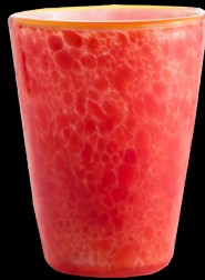
Star Fish Mares