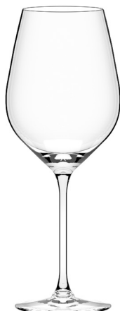
Easy large plus cc. 500