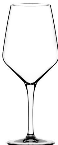
Bora large cc. 500