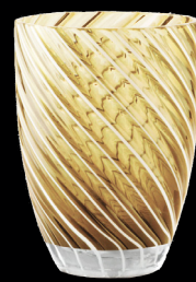
amber & white