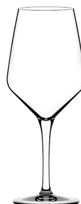
Bora medium cc. 390