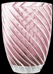
amethyst & white