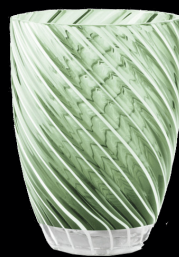
green & white