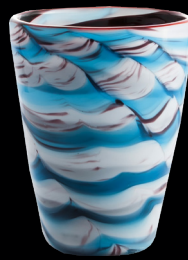
Napoleon Fish Mares