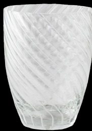
clear & white