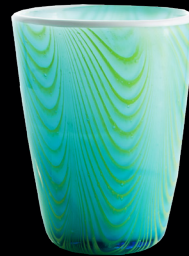
Jelly Fish Mares