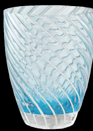
blue & white