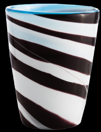
Clown Fish Mares