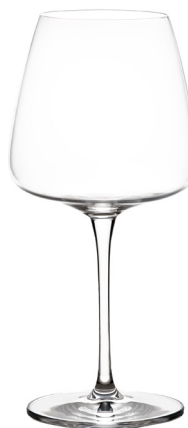
Audace Nero cc. 450