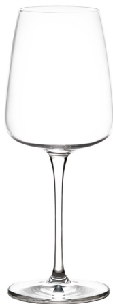
Audace Bianco cc. 450