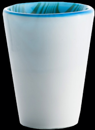
Angel Fish Mares