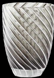
black & white