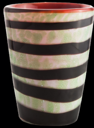
Tiger Fish Mares